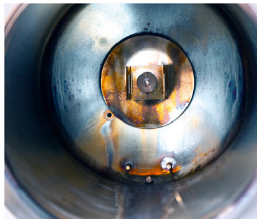
Ohne regelmäßige Kesselreinigung